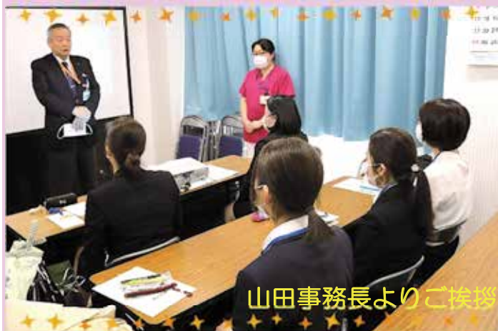
山田事務長よりご挨拶