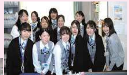
いつでも お気軽に お声掛けください