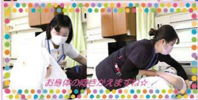
お身体の向きがえますね☆