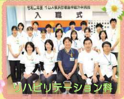
令和二年度 イムス横浜狩場脳神経外科病院 入 職 式