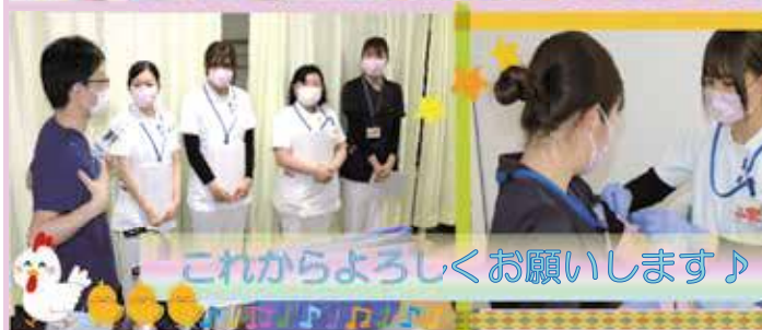
これからよろしくお願いします♪ 見かけたらいつでもお声掛けください!