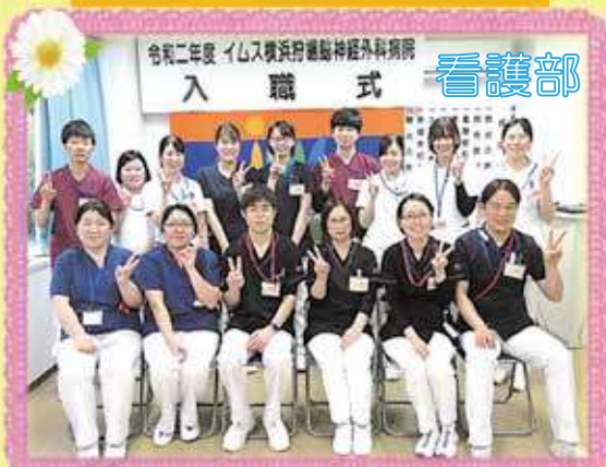
令和二年度 イムス横浜狩場脳神経外科病院 入 職 式 看護部