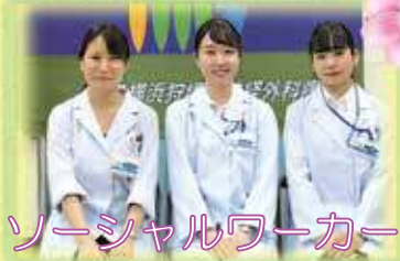
ソーシャルワーカー