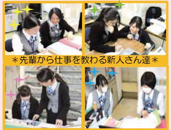
*先輩から仕事を教わる新人さん達*

新入職員も4名入職しました！若い力を借りて、事務部門一同ますますパワーアップしていきます！