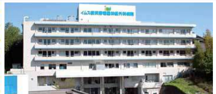
日本脳神経外科学会認定専門医研修施設 日本神経学会認定専門医研修施設 日本脳ドック学会認定施設

新年度を迎えて、当院もたくさんの新人が入ってきてくれました。真剣に仕事に取り組む様子を見ると、「自分はどうか？」と反省させられます。私の好きな作家 見城 徹の言葉に「自己検証・自己嫌悪・自己否定」というものがあります。突き詰めると、「妥協するな」という意味だと思えます。社会人生活も長くなってきましたが、これからも精進していきます。