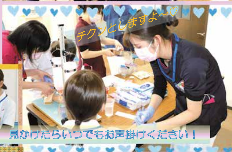
チクンとしますよ～♡