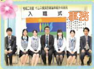
令和二年度 イムス横浜狩場脳神経外科病院 入 職 式 事務