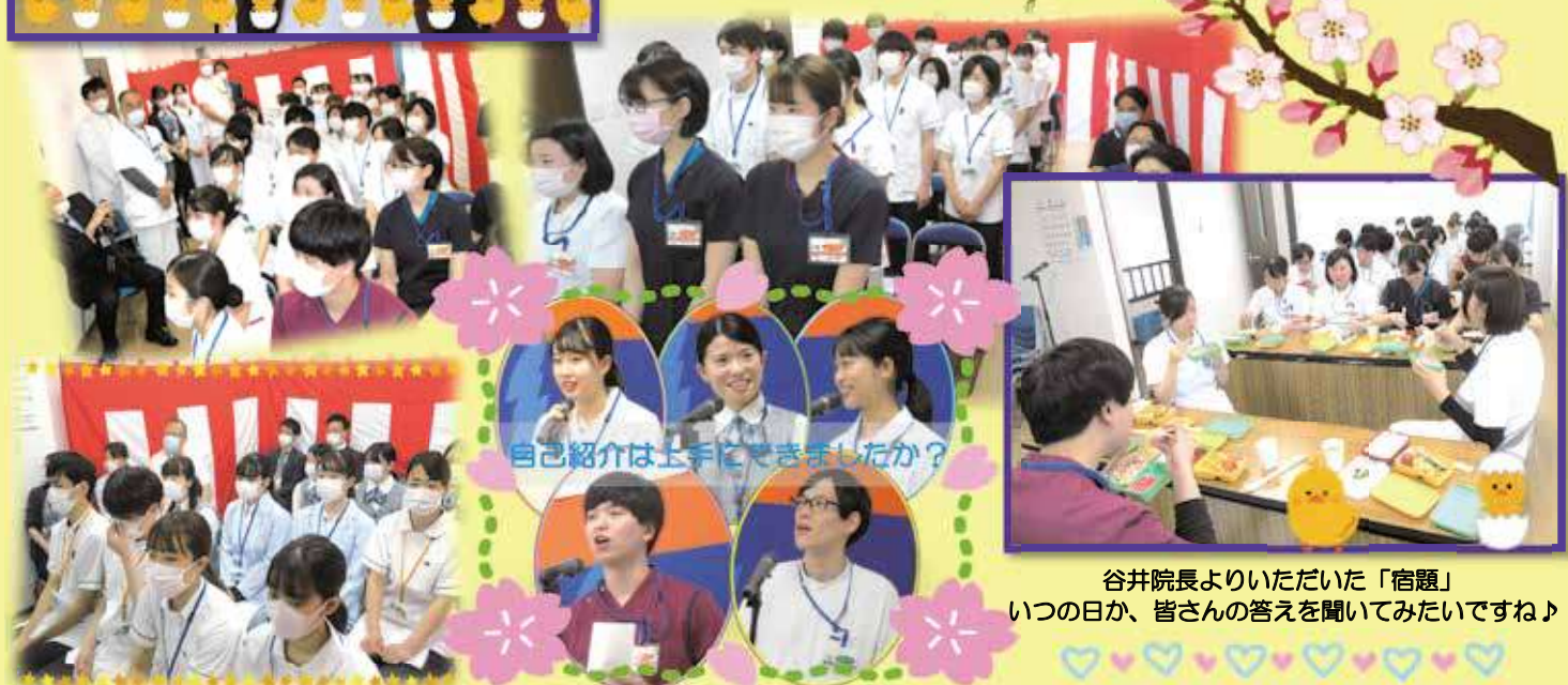
自己紹介は上手にできましたか？