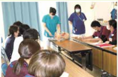
安心・安全の医療を提供するために