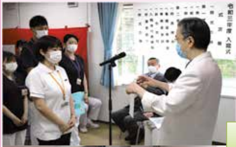
谷井院長より歓迎のお言葉