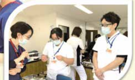
緊張している同僚を見守ります。