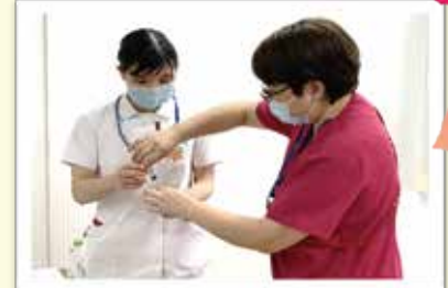
師長さんの指導にも熱が入ります！