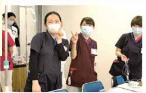
チクッとちょっぴり痛い思いも経験です。