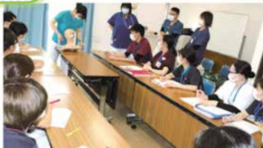
確かな知識と技術を身につけます。